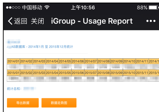
数据库使用系统报告（示例）