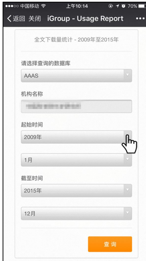
查询数据库使用统计